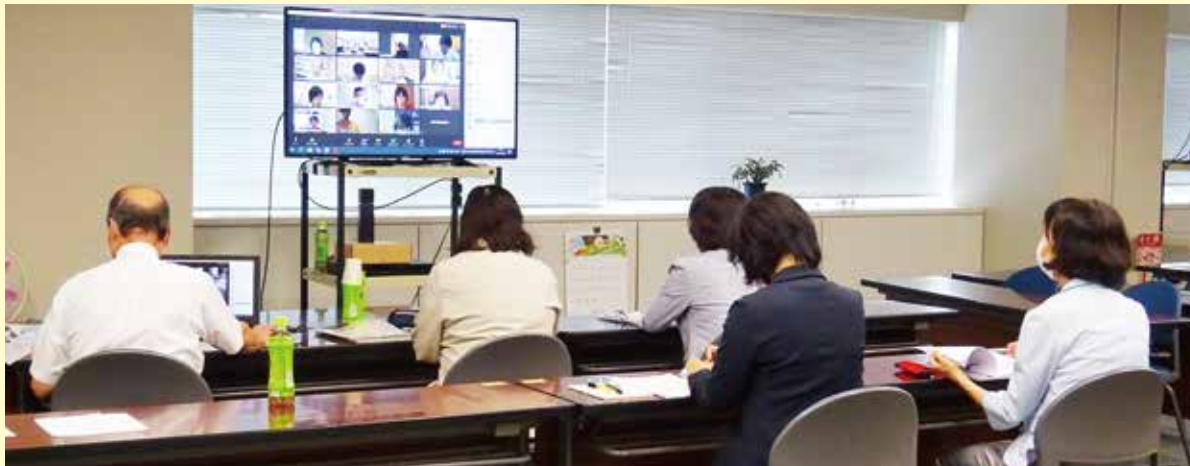
Zoomを活用し、オンラインで開催