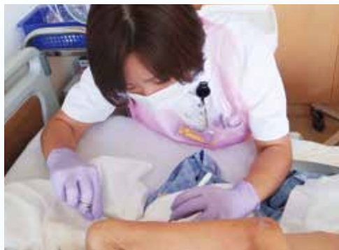
壊死組織のデブリードマン