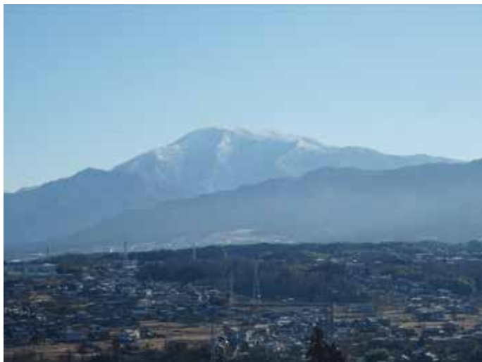
市立恵那病院から望む恵那山

また、役員会では、感染管理について相談する施設はありつつも相談を控えているといった事情なども知ることができ、施設代表者会議が情報共有の場として必要なことを再認識する機会となりました。そこで、他支部の取り組みを参考にさせていただき、東濃支部においてもメールによる情報共有を行う準備を始めました。全員参加はできませんが、何らかの形で皆さんの困りごとの解決の糸口とし、提案事項などを協会に届けるといった活動の広がりにつながるのではないかと期待しています。