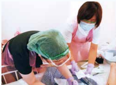
皮膚科医師との処置