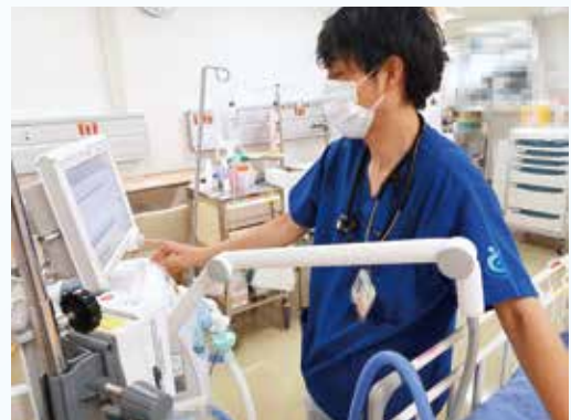
人工呼吸器の設定変更操作