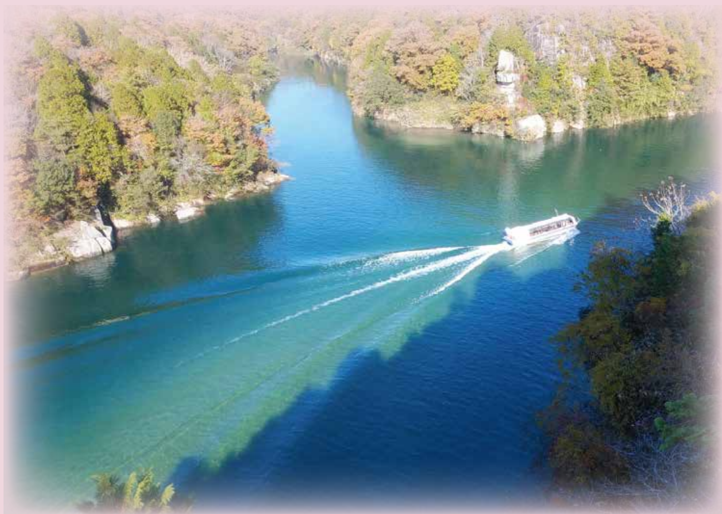
源濟公園(中津川市) 源濟岩から見える恵那峡遊覧船。紅葉と水の色がとても綺麗でした。