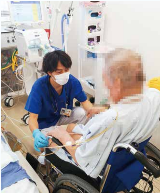
人工呼吸器を離脱してのリハビリをPTと一緒にしている