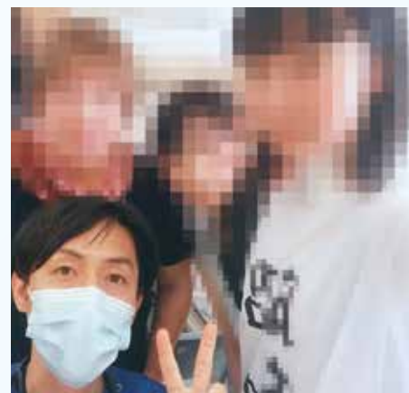
気管切開管理で在宅療養に移行した患者様の退院時