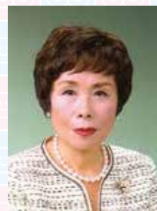
社会福祉法人旭川荘 旭川荘総合研究所 前 ナイチンゲール看護研究・研修センター

オンラインでしたが、直後から「看護の原点に立ち返ることができた」など多くの感想をいただくことができました。