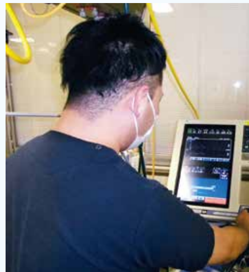
人工呼吸器の設定変更