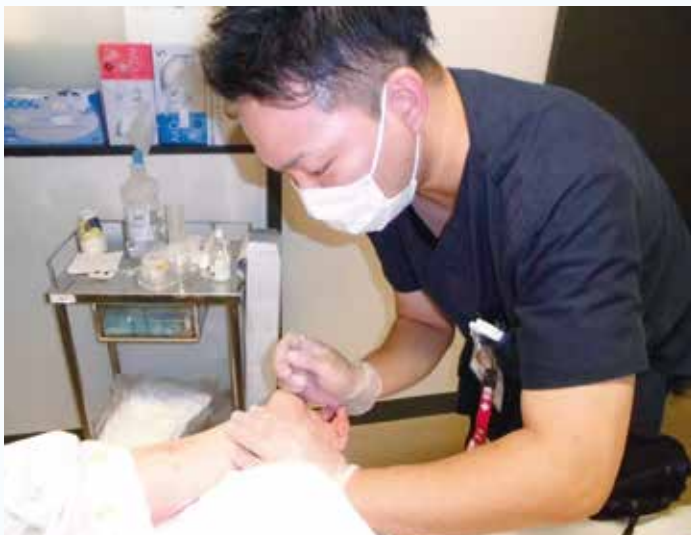
橈骨動脈からの動脈圧ラインの確保

安全に特定行為を実施していくためには、医師や他職種の理解と協力を得ていく必要があります。そのため、今後も医師と協働し、適宜手順書を作成、改訂しながら業務を実施していきたいと考えています。また、院内だけでなく在宅での特定行為の需要も高まっているため、幅広く活動できるようにさまざまな部署や機関との連携をとっていけるようにしたいと思います。