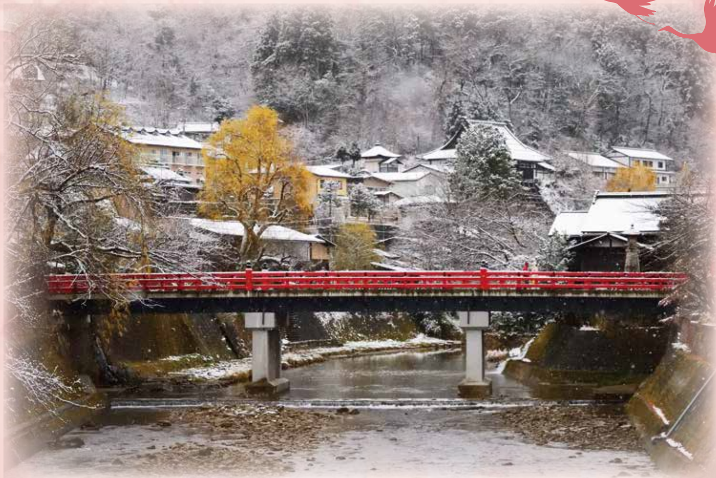
筏橋から望む赤い中橋(高山市) 何の変哲もない風景写真ですが、ただ素直に冬の高山を撮れた気がする。