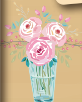
県立可児高等学校 担当 JCHO可児とうのう病院