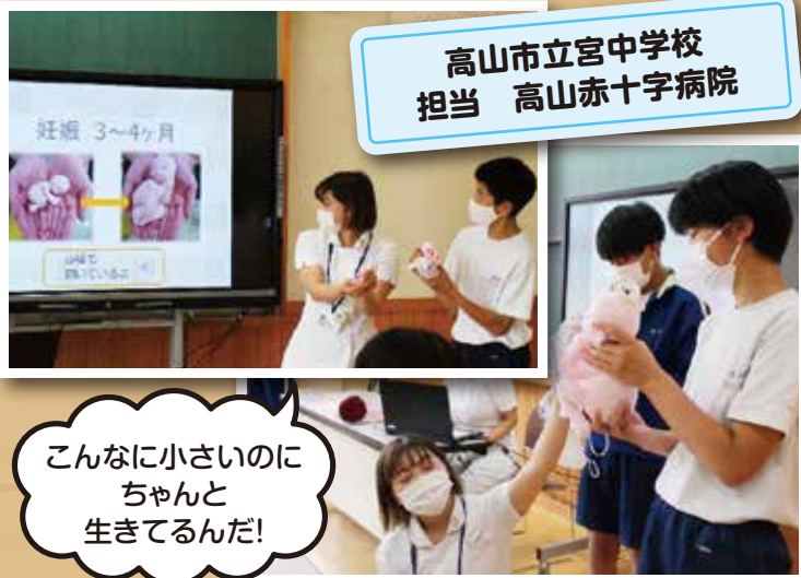
高山市立宮中学校 担当 高山赤十字病院