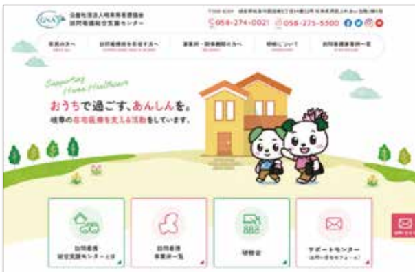
ホームページトップ画イメージ図