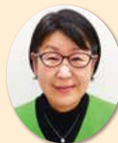
看護師職能委員会Ⅰ委員長 郡上市民病院

今後とも、引き続き活動へのご理解・ご協力をいただきたいと思います。よろしくお願いいたします。