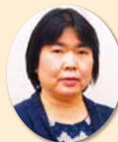
看護師職能委員会Ⅱ委員長 白川病院

今後は、委員会から提供した教育資料の活用状況の確認や、更なる看護職の質向上に繋がる活動をしていきたいと思っております。引き続き皆様に委員会活動のご理解とご協力をいただきたいと思いますのでよろしくお願いいたします。