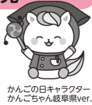
かんの日キャラクター かんのちゃん岐阜県ver.