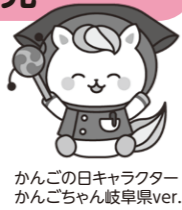
かんの日キャラクター かんのちゃん岐阜県ver.