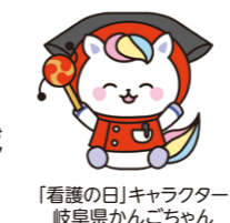
「看護の日」キャラクター 岐阜県かんごちゃん