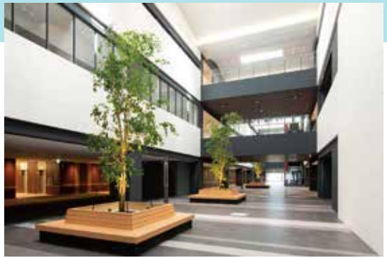
ホスピタルモール

添付した写真は、将来医療従事者になりたいという地域の小学生、中学生、高校生を招いてオープンホスピタルを開催