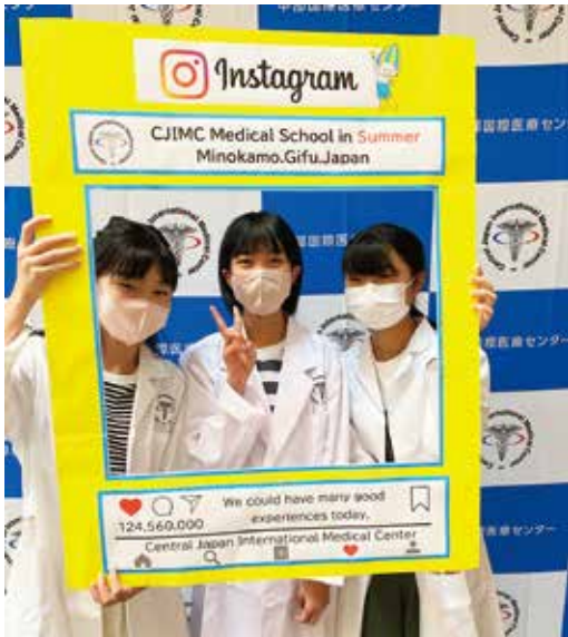
オープンホスピタルの様子