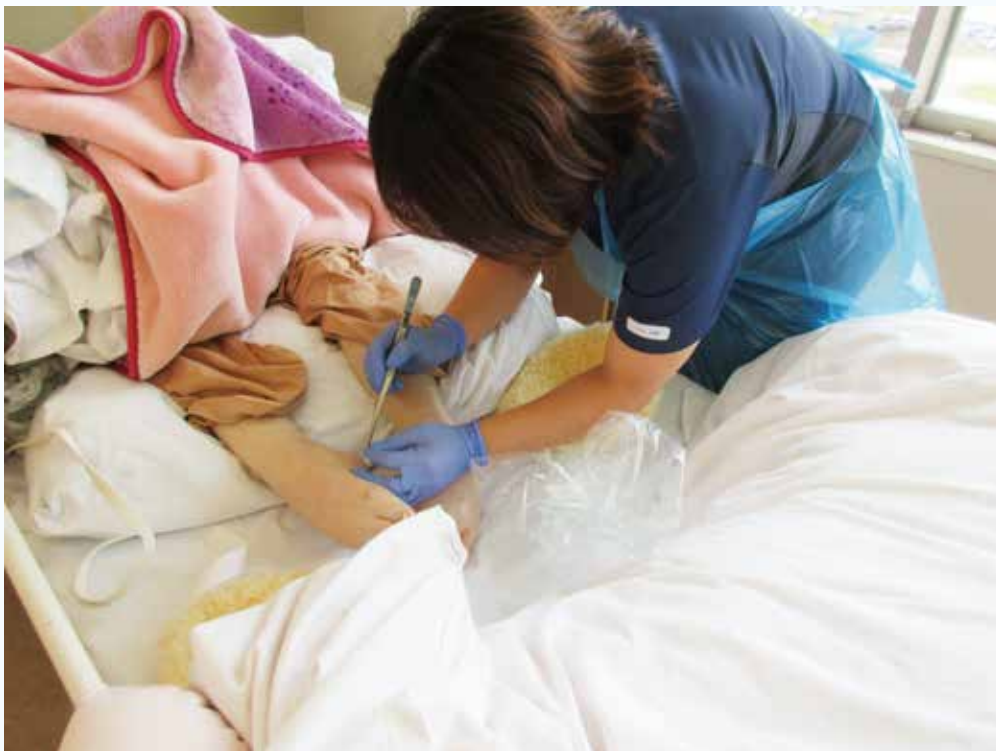
【修了区分】 ・創傷管理関連