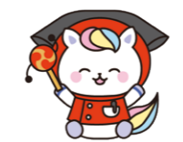
「看護の日」キャラクター 岐阜県かんごちゃん